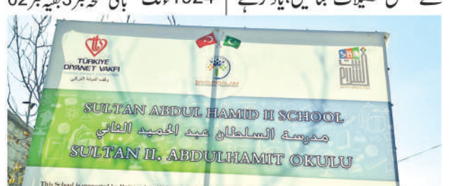
سلطان عبدالحميدالثاني سيموسوم اسكول جس كاخرج بيت السلام ویلفیترٹرسٹ نےاپیے ذمےلیاہے

خیمے آ فاداور دیانت کے توسط سے بھیجے ك بين، باقى صفح نمبر 3 بقينمبر 10